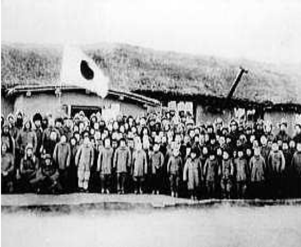
「開拓団」の国民学校